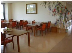
ダイニング：食事は此処でします