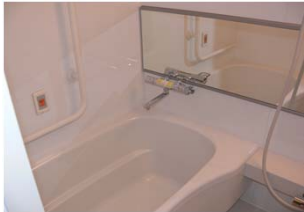
浴室：一般家庭浴室を3 箇所設置、隔日入浴を実現しています