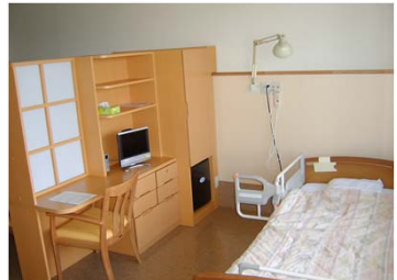
病室：4人部屋が主ですがプライベート空間を保つ構造です