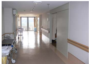
廊下：訓練も行います