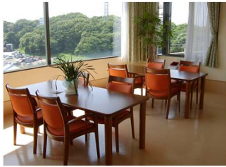
西デイコーナー： 富士山が見えます