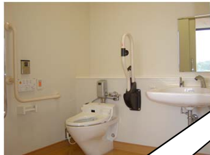
トイレ：9箇所設置し、車 椅子で余裕に動けます