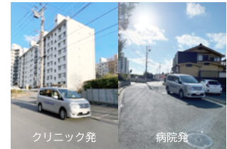
4. ドリームハイツ19号棟北