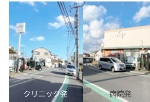
3. 生活協同組合コープかながわ和泉店