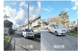
2. 下和泉ふれあい公園前