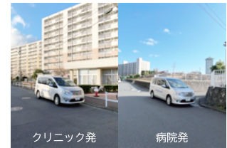
6. 市ドリームハイツ団地管理組合 事務所