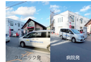
5. 横浜ドリームハイツ郵便局前