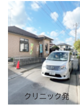
1. 富士塚自治会館前