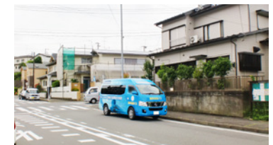
8. 汲沢団地バス停横