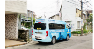
4. ヤマザキデイリーストア戸塚汲沢店跡