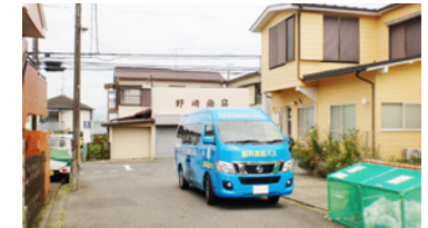
6. おどりば動物病院前