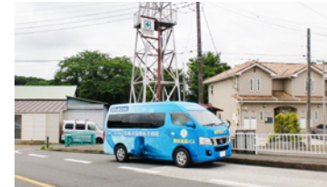
1. 中村三叉路バス停横