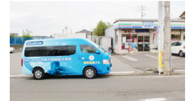
2. ローソン LTF 泉中田西店