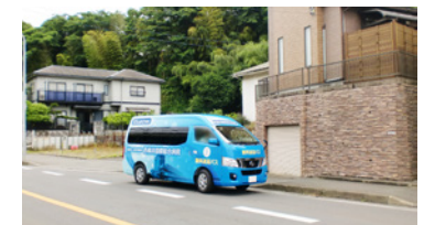
10. 宝寿院前バス停横