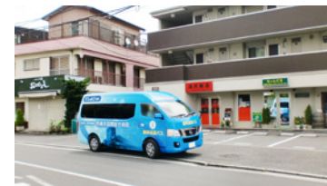
7. 旧汲沢飯店前(踊場地区センター前)