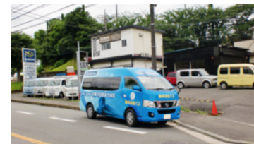
9. 桜陽高校バス停横