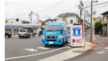
3. ローソン泉中田南5丁目店前