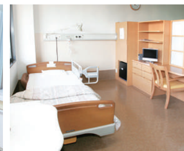
病室（回復期リハビリテーション病棟）