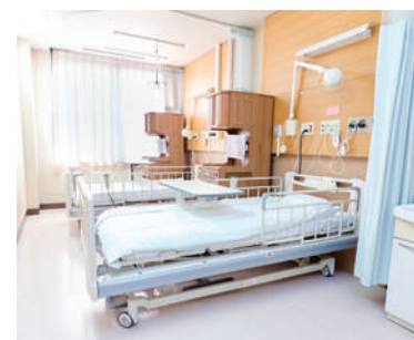
病室（地域包括ケア病棟）