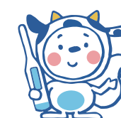
マスコットキャラクター りずもん