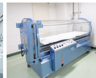
高気圧酸素治療室