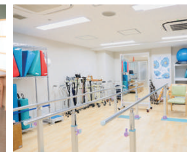
リハビリテーション室