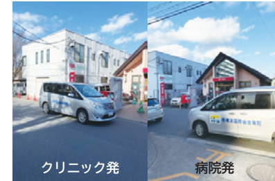
3. 横浜ドリームハイツ郵便局前