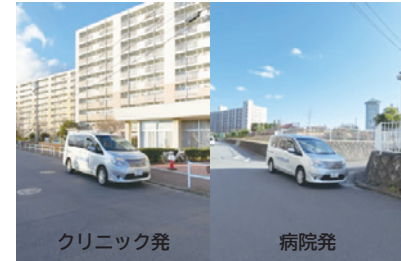
4. 市ドリームハイツ団地管理組合 事務所