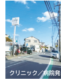
1. 生活協同組合コープかながわ和泉店