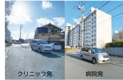
2. ドリームハイツ19号棟北