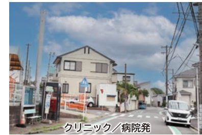
クリニック／病院発