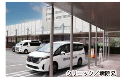
クリニック／病院発